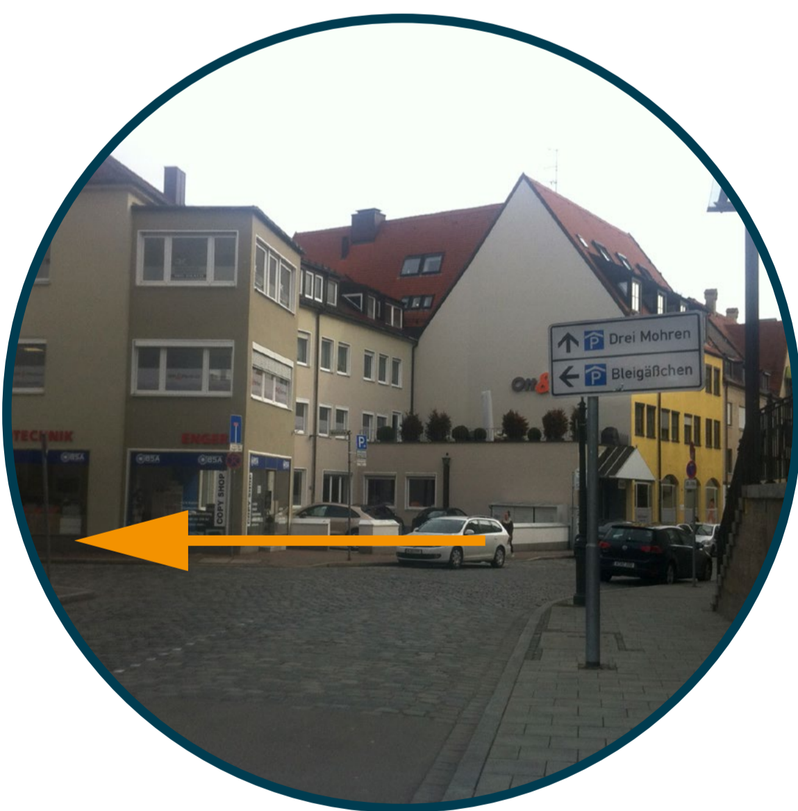
1 Blick vom KÖ in die Katharinengasse. Hier rechts dem Schild Parkhaus Bleigäßchen folgen.