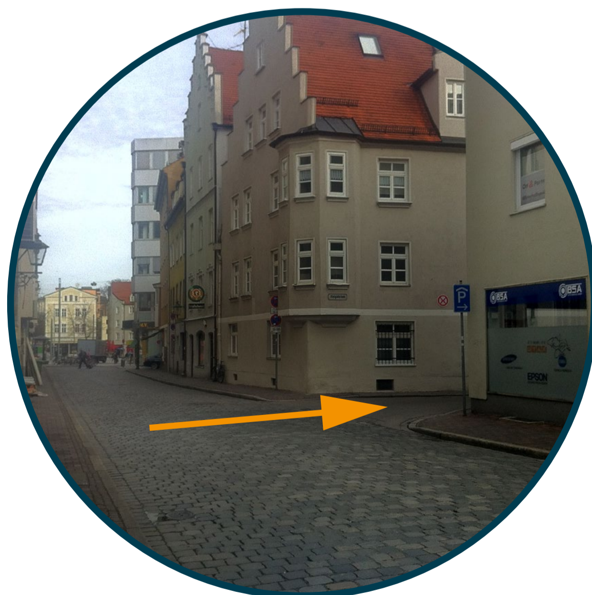
2 Von der Wallstraße gleich rechts in das Bleigäßchen....