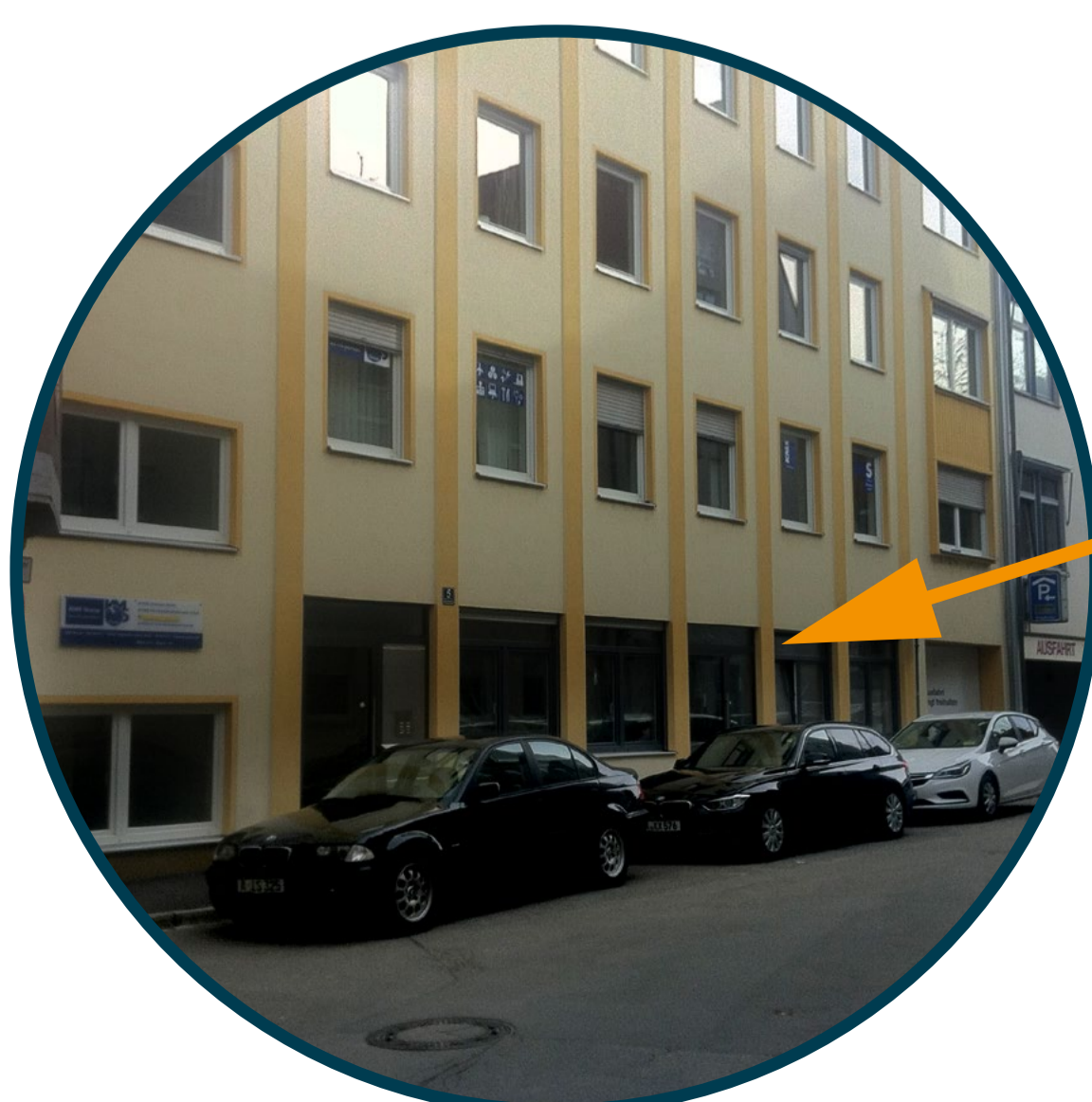
3 ...seht ihr dann vor euch auf der linken Seite schon den Eingang zu ESCAPEGAME Augsburg.